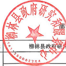
部门（单位）整体支出绩效自评表 （2025 年度）