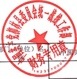
部门整体支出绩效自评表（2023 年度）