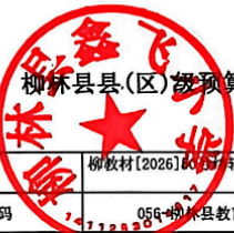
柳林县县(区)级预算部门(单位)项目支出绩效目标表