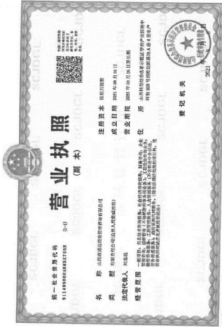
附件 3 第三方绩效评价机构资质证明