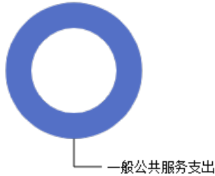
一般公共预算当年拨款结构图

2023年度一般公共预算当年拨款75.03万元,主要用于以下方面:一般公共预算服务支出75.03万元,占100.00%。