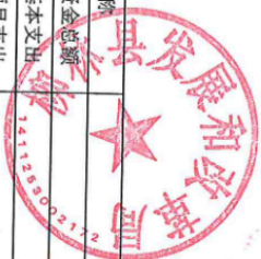
部门整体支出绩效目标申报表 (2025年度)